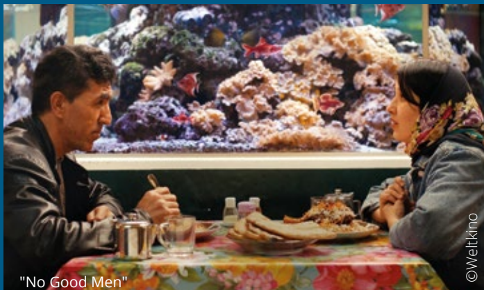
"No Good Men"